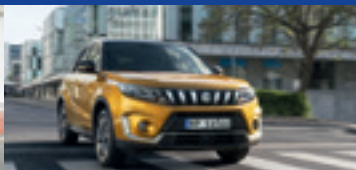
Suzuki Vitara Hybrid