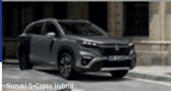
Suzuki S-Cross Hybrid