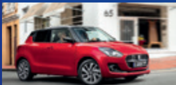
Suzuki Swift Hybrid