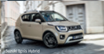
Suzuki Ignis Hybrid

Abbildungen zeigen aufpreispflichtige Sonderausstattung.