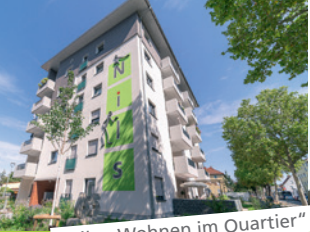
„Nils – Wohnen im Quartier“