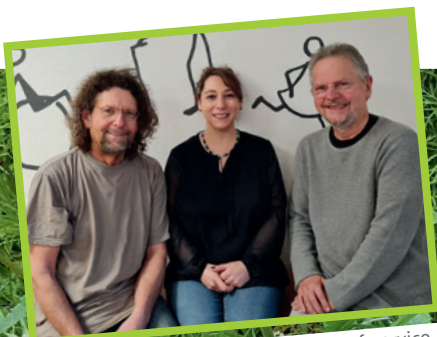
Das Team des Einkaufsservice

Wenn Sie also ein Anliegen haben, Unterstützung benötigen oder Sie einfach nur ein offenes Ohr zum Reden brauchen? Wir sind für Sie da! Zögern Sie nicht und rufen Sie uns gerne an! Alle Kontaktdaten finden Sie auf der nächsten Seite.